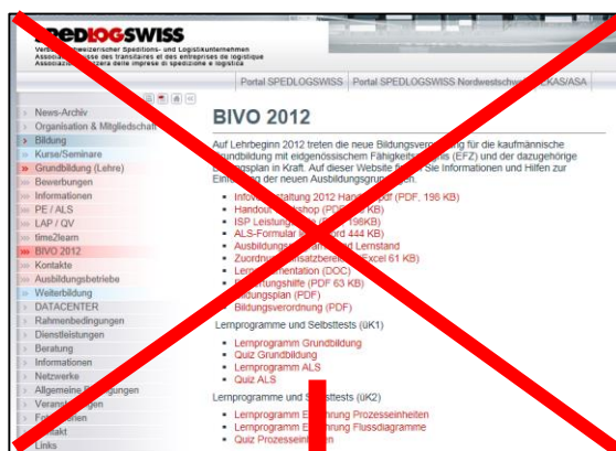
Alte Struktur Grundbildung

Damit Sie sich auch im Bildungsbereich leichter zurecht finden, haben wir für Sie eine kleine Navigationshilfe erstellt. Die untenstehende Abbildung zeigt, wo Sie auf der neuen Website alle relevanten Dokumente und Informationen zur Grundbildung finden. Die einzelnen Themen sind neu und übersichtlich gegliedert. In der Unterrubrik „Überbetriebliche Kurse“ z.B. finden Sie die für die Lernenden verschiedenen Vorbereitungsaufträge, die als Hausaufgabe für die überbetrieblichen Kurse benötigt werden.